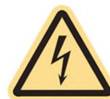
Рисунок 1 — Маркировка СХЭА

Этот предупреждающий знак должен быть виден при доступе к СХЭА.