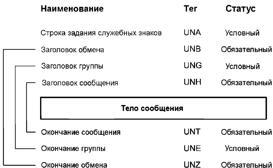
Рисунок 1 – Структура обмена для пакетного ЭОД

Строка задания служебных знаков (в случае ее использования), а также служебные сегменты заголовка и окончания (за исключением служебных сегментов, используемых для защиты и для ассоциируемых данных и определяемых в соответствующих частях настоящего комплекса стандартов) при пакетном ЭОД должны следовать в порядке, указанном на рисунке 1.