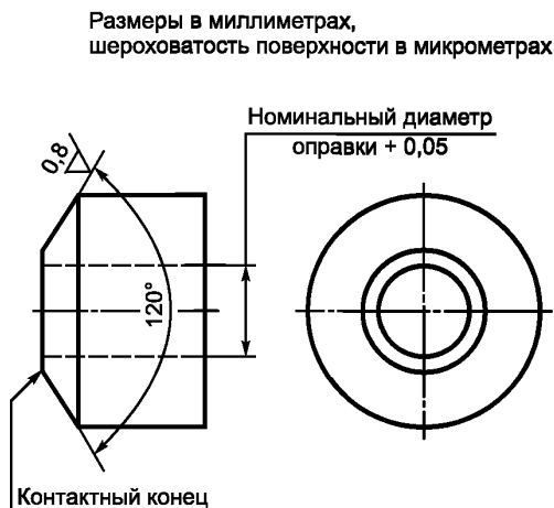
Рисунок 1 — Коническая шайба

4.2 Оправка, закаленная (не менее 45 HRC) и снабженная резьбой с полем допуска 6g , за исключением допуска наружного диаметра, располагающегося в последней четверти диапазона 6g со стороны минимума материала.