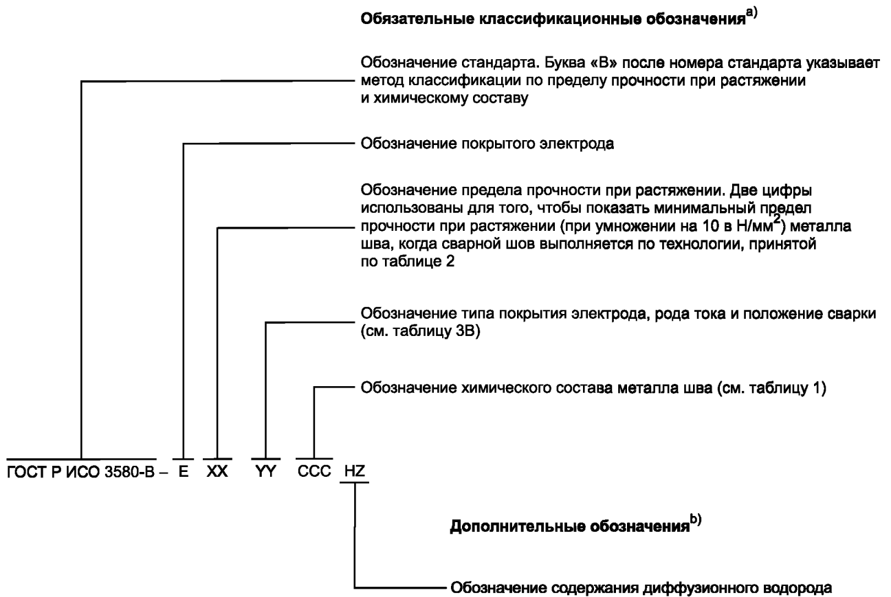
Рисунок А.2 — Метод классификации покрытых электродов по пределу прочности и химическому составу для сварки жаропрочных сталей

Метод классификации покрытых электродов по пределу прочности при растяжении и химическому составу в соответствии с ГОСТ Р ИСО 3580 показан на рисунке А.2.