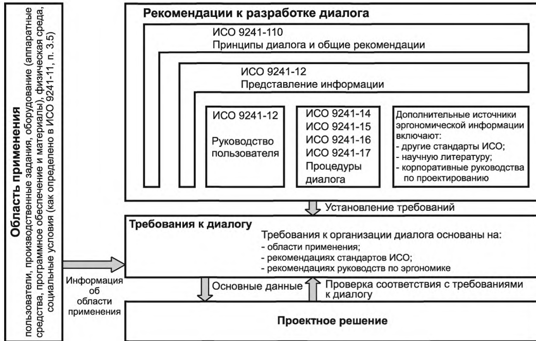
Рисунок 1 — Структурная схема применения настоящего стандарта

Настоящий стандарт является основой для установления требований к организации диалога, однако не определяет непосредственно эти требования. Требования к организации диалога зависят от области применения, для которой интерактивная система разработана и/или в которой ее используют, и требований, разработанных для этой области применения.