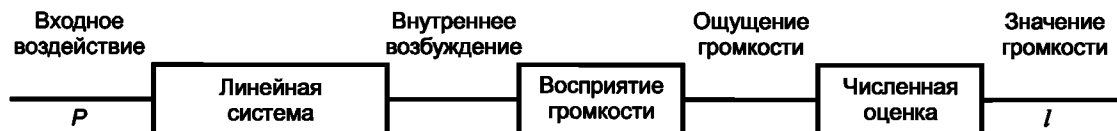
Рисунок С.1 — Блок-схема модели процесса оценки громкости

На рисунке С.1 приведена блок-схема описанной модели.